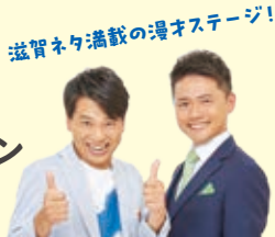
滋賀ネタ満載の漫オステージ!