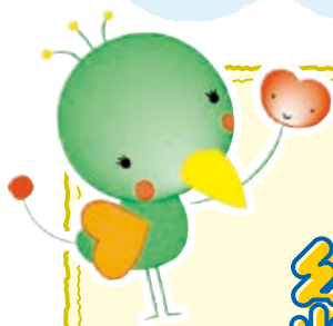
みとりちゃん HIROMI W