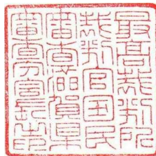
30ミリメートル平方