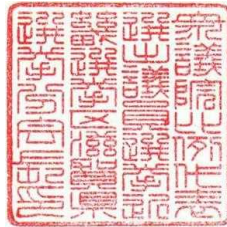
30ミリメートル平方