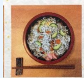
しらす ちらし寿司

築地から取り寄せているマグロ！日本海でとれた新鮮な、お魚を使用しています。 内容、価格などはご相談に応じます。お気軽にご相談ください。