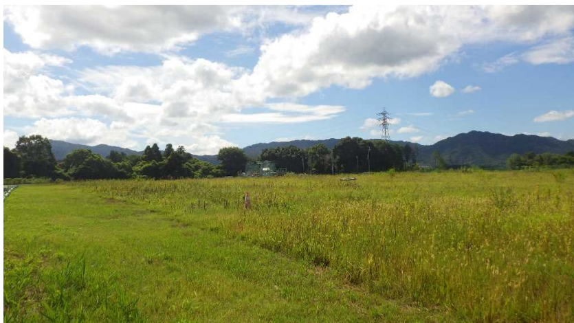
写真① 天端部の様子