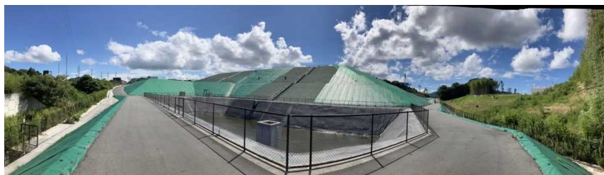
写真② 調整池付近の様子