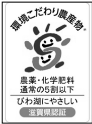
環境こだわり農産物の認証マーク

農薬と化学肥料を通常の5割以下に減らすとともに、びわ湖や周辺環境に配慮して栽培された農産物を県が認証し、「環境こだわり農産物の認証マーク」が付されたもの