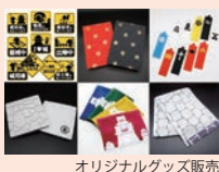
オリジナルグッズ販売

日本最大級! 30万人が熱狂するスマートフォン 向け城郭アプリ「ニッポン城めぐり」のレア異名 が当たるガラポン抽選会を開催します。