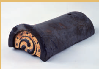
安土城跡出土 金箔瓦(滋賀県蔵)