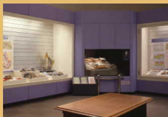
安土城跡の発掘調査