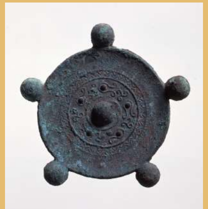
山津照神社古墳出土 五鈴鏡(山津照神社蔵)