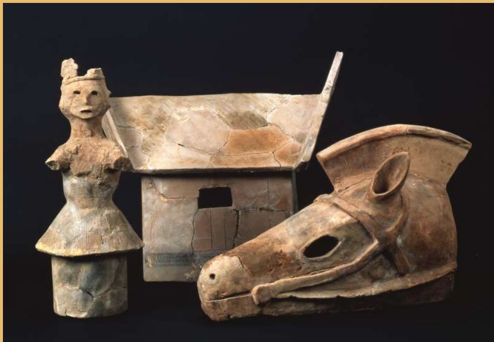
供養塚古墳出土 人物埴輪・家形埴輪・馬形埴輪(当館蔵)