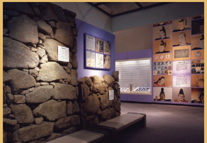
信長の肖像と石垣レプリカ