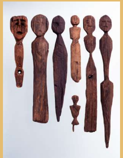
木偶 大中の湖南遺跡(当館蔵) 湯ノ部遺跡・烏丸崎遺跡(滋賀県蔵)