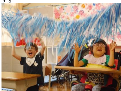
小学部 遊びの指導「ふれる」

中学部では、将来の自立に向けた基礎を作るため、生活単元学習などを通して自分で考え行動する力を育てていくことを大切にしています。また、生徒同士の関わり合いを重視する視点から、学級を越えた多様なグループでの学習も意図的に設定し展開しています。自立活動の学習では、健康な身体づくりをはじめ、運動機能やコミュニケーションなど、一人ひとりの課題に対応した取り組みをしています。