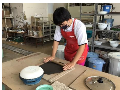
高等部 作業学習「窯業」

伊吹分教室では、職業的自立と社会参加を目標に、生徒一人ひとりの課題に応じた教育を実践しています。教科学習では、「生活する力」「考える力」を育てます。作業学習では、農園芸、木工、食品加工等の作業を通して、「働く力」を育てます。高等学校内に設置された特色を生かし、伊吹高校との交流にも積極的に取り組んでいます。