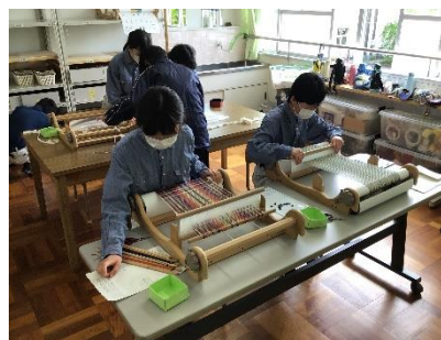
伊吹分教室 作業学習「布加工」