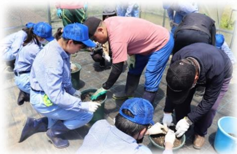
専門教科「農業」 (地元との連携授業)

1クラス8人程度の少人数で、基礎学力の充実を図り、社会的・職業的自立ができるように、一人ひとりの障害の状況や特性を把握し教育活動を展開する。