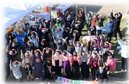
あいあいフェスタ (創立10周年記念事業)

校舎は、愛知高校と同じ敷地内に併設していて、施設や設備を共有しています。そして愛知高校と同じ日課（校時）で学習しています。入学式、卒業式、始業式等の儀式的行事や体育祭・文化祭・避難訓練等の学校行事・生徒会行事は両校合同で行います。また、交流及び共同学習等もできる限り連携して運営・実施しています。部活動についても、学習と共に重要視しており、全員参加を推進しています。本校と愛知高校の生徒が同じ部活動に参加し、両校の教員が互いの生徒を指導するなど、併設校としての利点を生かし、交流を図りながら活動しています。その取組により令和5年度に滋賀県インクルーシブ教育賞を受賞しました。