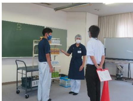
学校設定教科（スキルアップ）