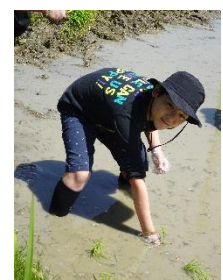
小学部 生活「棚田植え」