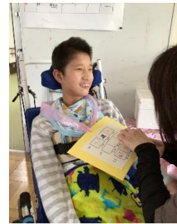
中学部 スタンプラリー

児童生徒も登校するようになりました。児童生徒数は開校当初の約3倍に増加したことから、平成25年度に近隣の県立石部高等学校内に高等部単独の『石部分教室』が開設されました。この分教室は、「野洲」「草津」両養護学校および八日市養護学校の一部の通学区域に居住する生徒も対象としています。現在は紫香楽校舎を含め、312名の児童生徒が6台のスクールバスや公共の交通機関等を使って通学しており、近隣の施設からも33名の児童生徒が通ってきています。また、紫香楽校舎は紫香楽病院の重心病棟から、隣接する校舎に登校する児童生徒と、ベッドサイド授業を行う児童生徒合わせて10名が学習をしています。