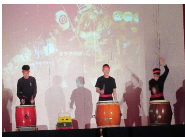
高等部 学習発表会