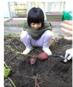
小学部 生活「芋ほり」

本校は、湖南市の西方に位置し、周りを自然豊かな山や林に囲まれた閑静なところにあります。昭和51年4月に、近隣の児童福祉施設内(県立近江学園、社会福祉法人椎の木会落穂寮)に設置されていた小学校・中学校の分校が独立し、知的障害のある施設入所の子どもたちが学ぶ学校として開校(県立石部養護学校)しました。その後、昭和54年4月の養護学校義務制実施により、校名を県立三雲養護学校と改め、現在の地に小学部・中学部の校舎を建設移転しました。同時に、地域からの通学生の受け入れと、独立行政法人国立病院機構紫香楽病院に入院中の児童生徒への訪問教育が始まりました。昭和57年には、高等部とともに紫香楽校舎が設置され、平成3年4月の全県的な学区再編成を経て、湖南市・甲賀市や近隣施設から知的障害の児童生徒に加え、肢体不自由の