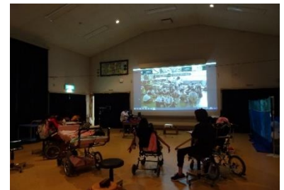
紫香楽校舎 交流会（リモート）