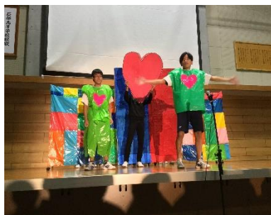
石部分教室 文化祭

とし、小中高一貫性のある教育の創造と実践、及び高等部を中心とした職業教育の充実を図っています。また、個別の教育支援計画や個別の指導計画を活用し、保護者や関係機関との連携のもと、将来に向けた視点に立った、児童生徒の自立に向けた力を育てることに努めています。