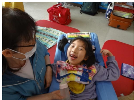
「みる・きく」の学習の様子

小学部では、「心も身体も健やかに、人との関係の中で主体的に活動する」ことを目指して取組を進めています。まずは、12 年間の学校生活の基盤づくりとして、「生活リズムを身につけ、健康な生活をおくる」ことや「基本的な生活習慣を学ぶ」ことに重点を置いています。これらのことが基本となって、周囲で起こっていることに気持ちを向けることができるようになり、「大人からの働きかけを受けとめ、思いや要求をしっかりと表し伝える」ことや「集団の中で、見通しをもって意欲的・主体的に活動する」ことにつながっていくものと考えています。子どもたちが、意欲的・主体的に活動できることは、将来にわたって生きていく上での基礎となる力であると考えています。