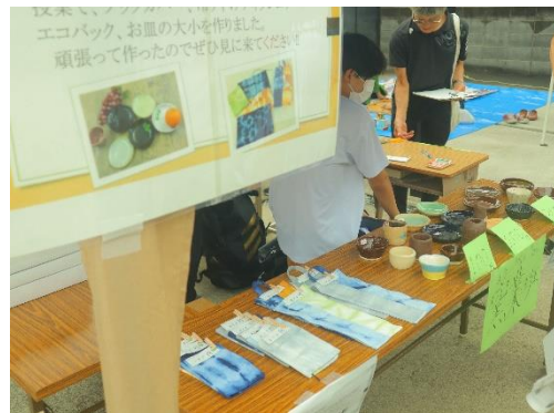
高等部 鳥居本宿場まつり