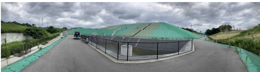
写真② 調整池付近の様子