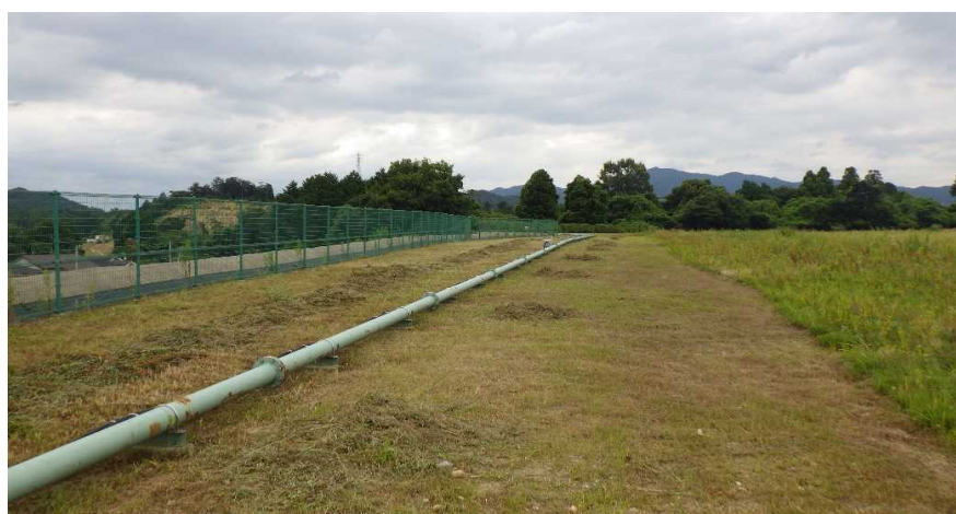
写真① 天端部の様子