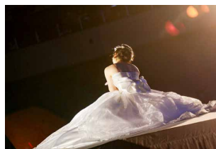
大華祭・家庭科学科ファッションショーより