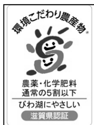
環境こだわり農産物の認証マーク

農薬と化学肥料を通常の5割以下に減らすとともに、びわ湖や周辺環境に配慮して栽培された農産物を県が認証し、「環境こだわり農産物の認証マーク」が付されたもの