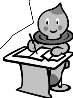
滋賀県の イメージキャラクター うおーたん