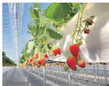
みおしずく果実(上)と栽培の様子(下)