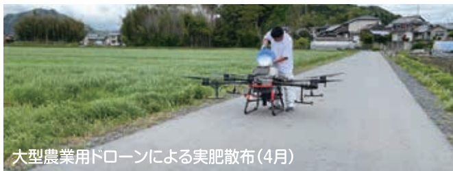
大型農業用ドローンによる実肥散布(4月)

2月と4月に実施した実証では、作業の省力化と精密化をねらいとし、衛星画像をもとに作物の生育状況の分析を行うシステム「ザルビオ ® フィールドマネージャー」と、GPS連動が可能なブロードキャストや大型の農業用ドローンといったデータ連動型農業機械を組み合わせることで、生育に応じて自動で施肥量を調整できることを確認しました。今後、技術の有効性などの評価をすすめ、地域での普及性を検討します。