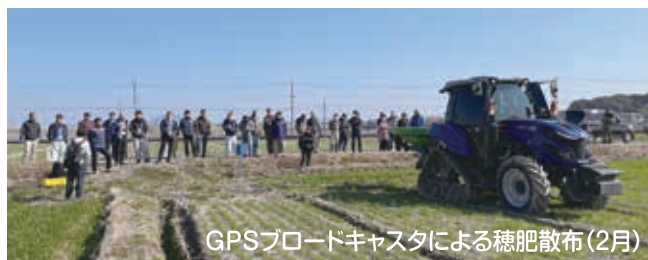
GPSブロードキャストによる穂肥散布(2月)

農作物の収量・品質向上や労力不足といった課題の解決策として、管内では直進アシスト機能付きの田植機の導入や農業用ドローンによる農薬散布などのスマート農業に取り組む事例が増加しています。当課では、スマート農業技術の活用をさらに促進するため、小麦における自動可変施肥の実証を行いました。小麦の穂肥や実肥の散布は、動力散布機を用いて行われることが多く、身体的な負担が大きい作業です。また、作業者の経験や勘に基づいて散布されることから、散布ムラが生じやすく、収量や品質がばらつく原因のひとつとなっています。