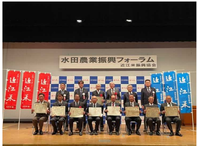
受賞者の集合写真