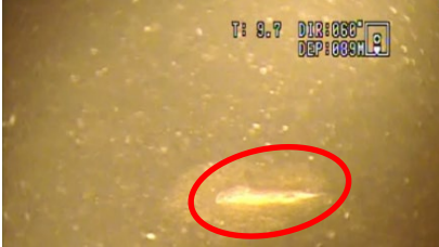
全層循環の未完了に伴う北湖深水層の負酸化によるイササの死亡(令和2年9月)