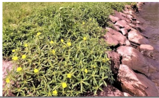
石組み護岸に生育したオオハナミスキンバイ

農地等での新たな生育の確認や石組み護岸やヨシ帯など機械駆除困難区域への対応が課題