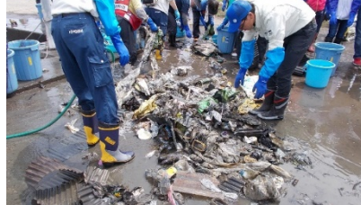
琵琶湖のプラスチックごみ実態把握調査(令和元年6月 赤野井湾)