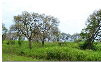
ヨシ群落内で巨木化したヤナギ

ヨシ群落の面積は概ね昭和30年代と同程度にまで回復したが、群落内のヤナギの巨木化等によるヨシの生育不良が見られる