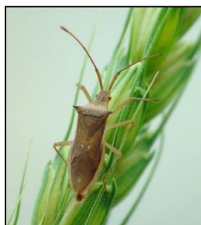
ホソハリカメムシ