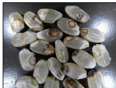
斑点米(着色しているもの)

お問い合わせ先：滋賀県病害虫防除所 TEL:0748-46-4926 FAX:0748-46-5559 Email:GC70@pref.shiga.lg.jp http://www.pref.shiga.lg.jp/boujyo