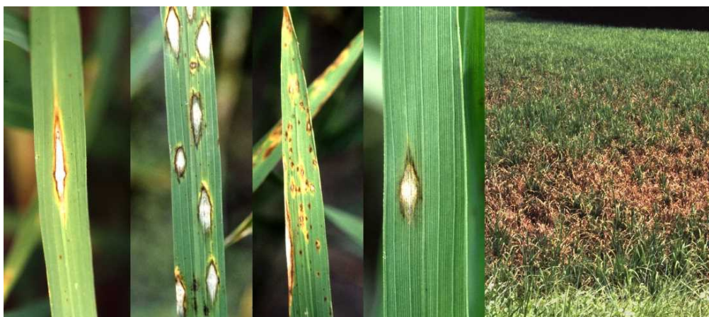
写真：葉いもちの病斑とすりこみ症状の発生例

葉いもちは穂いもちの発生源となります。例年いもち病が発生しやすいほ場を中心に見回り、発生が認められた場合は必要に応じて防除しましょう。