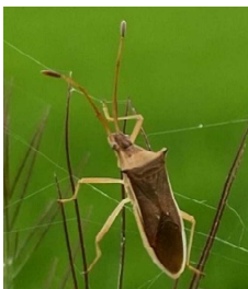
ホソハリカメムシ