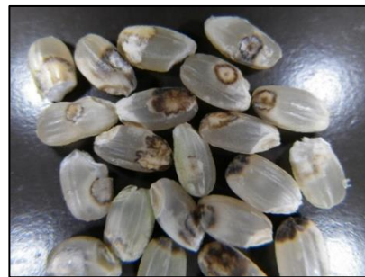
斑点米(着色しているもの)

お問い合わせ先: 滋賀県病害虫防除所 TEL: 0748-46-4926 FAX: 0748-46-5559 Email: GC70@pref.shiga.lg.jp http://www.pref.shiga.lg.jp/boujyo