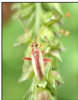
アカスジカスミカメ