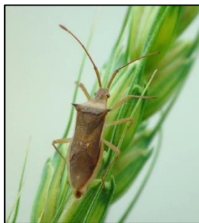
ホソハリカメムシ