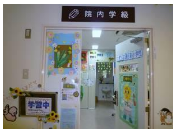
院内学級「ひまわり」教室の入口