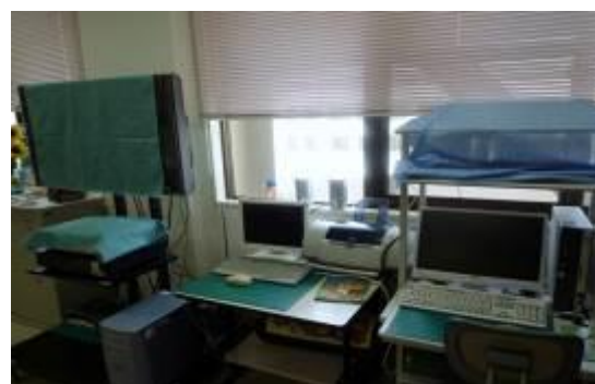
インターネットで調べ学習もできるよ