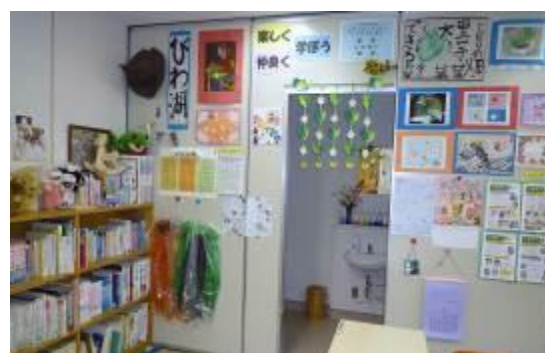
図書の貸し出しもしています