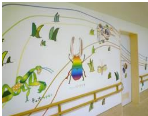
楽しいイラストのある廊下

教室は小児病棟(5A)の奥にあり、学級担任が毎日異学年の複数の児童を同時に指導しています。個別指導を中心にし、教科によっては全体指導もします。休み時間を確保するとともに、医療との連携を重視し、体調や治療に合わせて授業を進めるようにしています。