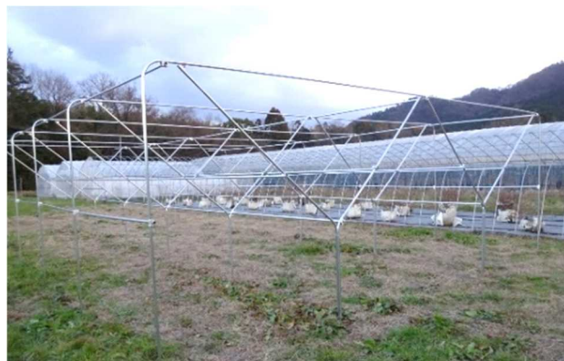
低樹高栽培用の簡易棚