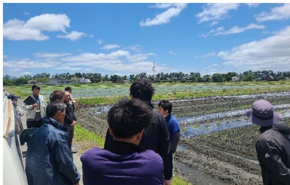
現地ほ場での意見交換

当課では今後もJAと連携して、ほ場巡回や研修会を実施することで高品質なまくわうりが生産されるよう支援します。