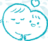
寄り添い型の総合支援

ひとり親の方からの、生活費など生計に関わることや仕事のこと、奨学金に関すること、住まいのこと、その他子育てに関することなど、様々な相談について、専門の相談員がアドバイスやサポートを行っています。相談は、LINEやメール、電話、オンライン(Zoom)、来所で行っていますので、いずれか相談のしやすい方法でご連絡ください。