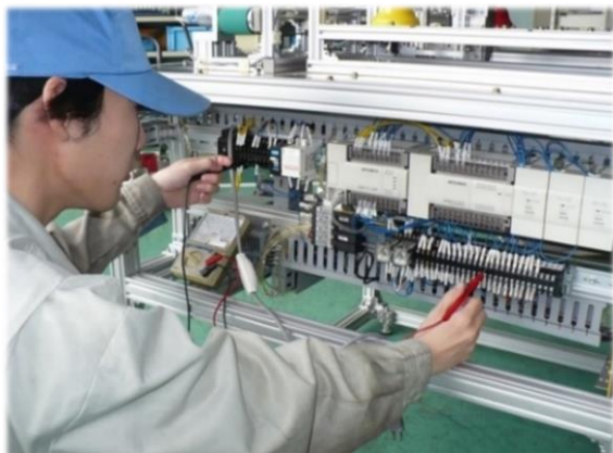
メカトロニクス科