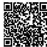
▲省エネ通知のページQRコード