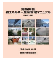
▲省エネマニュアル