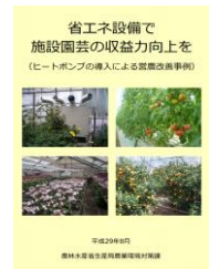
▲省エネで収益力向上を