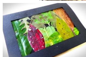
はっぱのステンドグラス