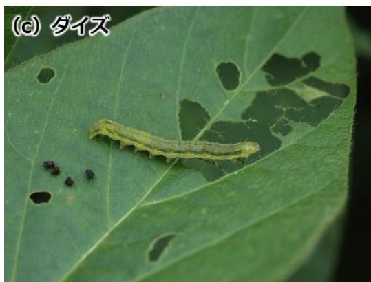
写真 タバコガ類幼虫による食害