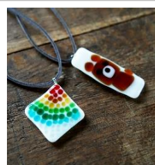
ペンダント 3.5cm × 3.5cm or 2cm × 2cm