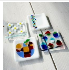
まめ皿 9cm × 9cm