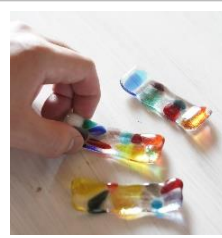
はしおき 2.5cm × 7cm