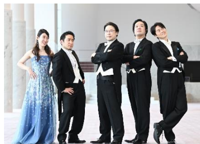
びわ湖ホール四大テノール