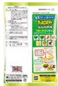
パッケージ表示の見方