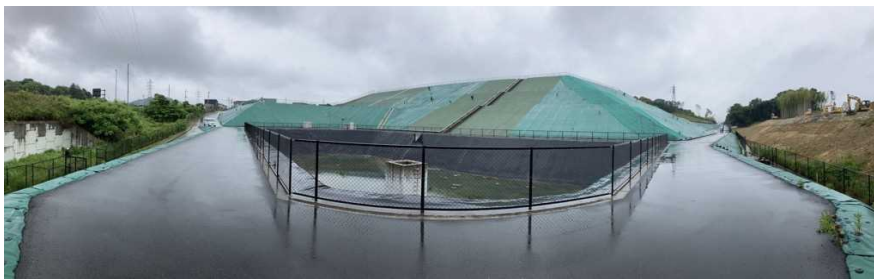
写真② 調整池付近の様子