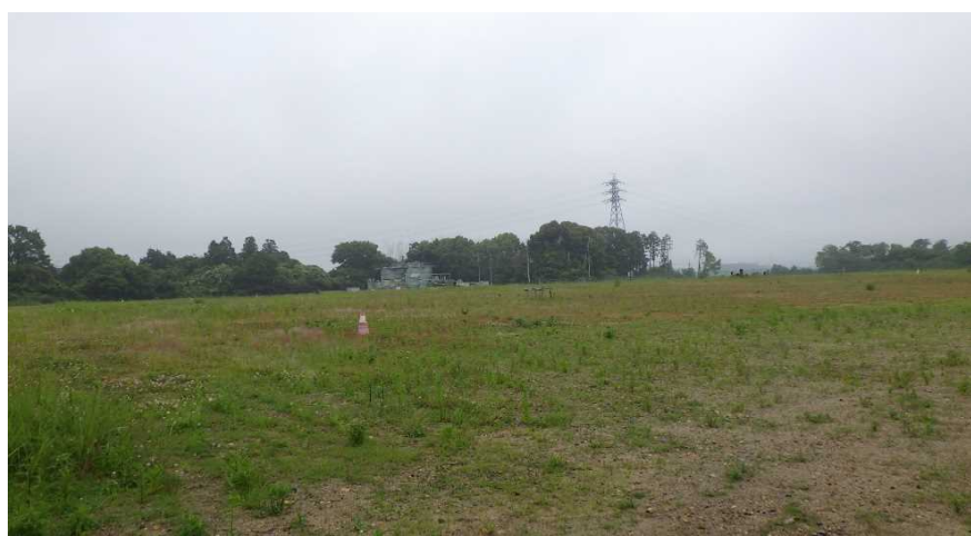
写真① 天端部の様子