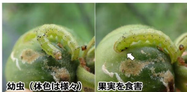
写真 ミニトマトの果実を加害するタバコガ類幼虫

お問い合わせ先：滋賀県病害虫防除所 TEL:0748-46-4926 FAX:0748-46-5559 Email:gc70@pref.shiga.lg.jp http://www.pref.shiga.lg.jp/boujyo/