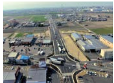
都市計画道路片岡東線