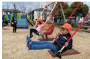
湖岸緑地豊田・雄琴地区（衣川）