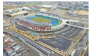
彦根総合スポーツ公園