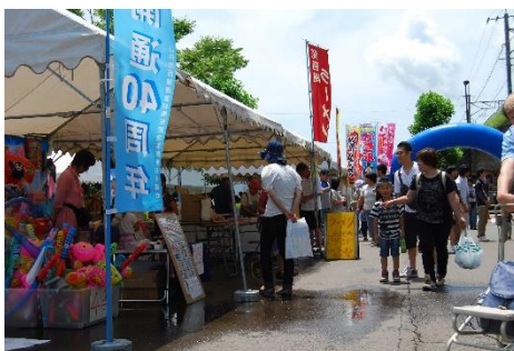
（参考）湖西線開通 40 周年記念事業の様子