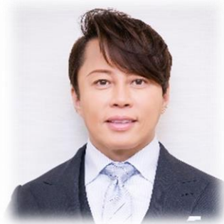
滋賀ふるさと観光大使 西川貴教 氏