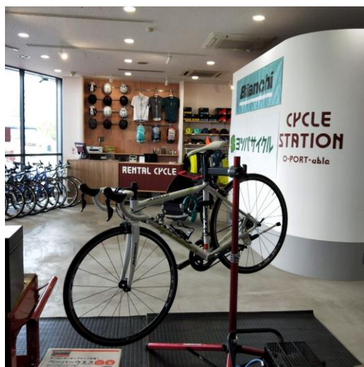
大津港サイクルステーション