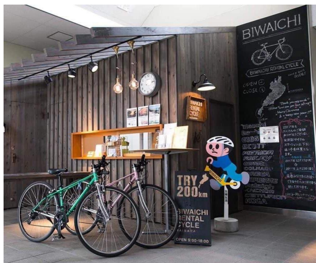
米原駅サイクルステーション

それらのサイクルステーションにて、10月頃から11月9日まで社名ロゴ入りのビワイチの日を広報する卓上サイズのミニのぼりなどを設置し、ビワイチを応援してくださっている企業様として、PRさせていただきます。