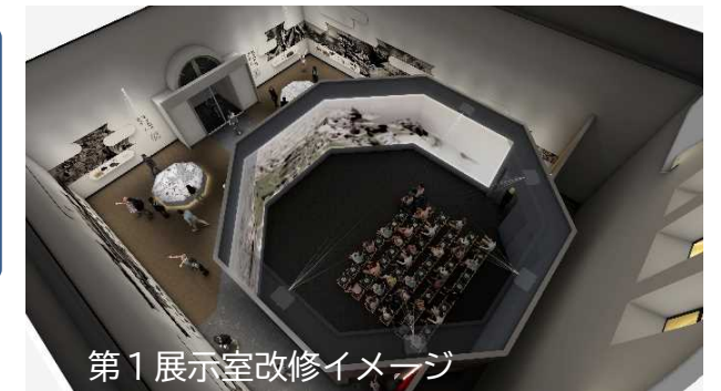
第1展示室改修イメージ

※ 春季特別展「稀品・逸品—滋賀県出土の指定文化財を中心に—」（4月27日～5月26日）