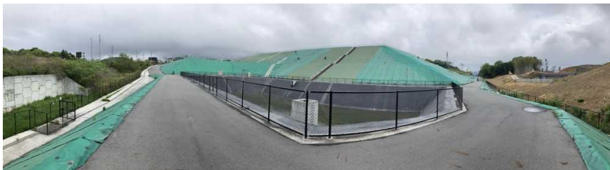
写真② 調整池付近の様子