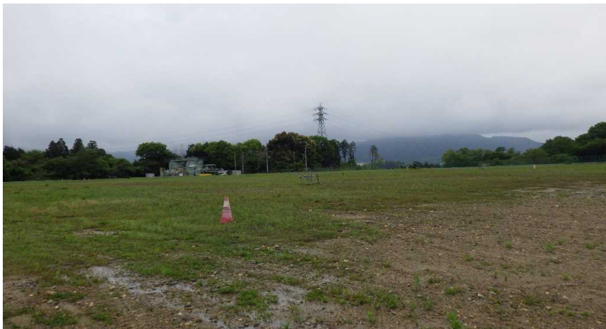
写真① 天端部の様子