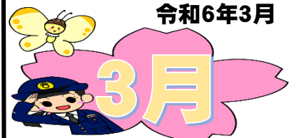
【非行少年等検挙補導状況一覧表】