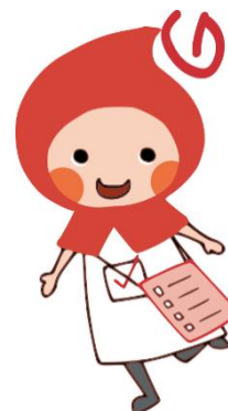
「滋賀県健康づくりキャラクター クミ」