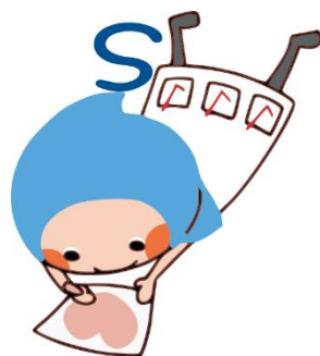
「滋賀県健康づくりキャラクター ハグ」

これをご覧になる支援者の皆様にとって、この冊子が支援の一助となり、少しでも多くの若年性認知症の人が、住み慣れた地域で自分らしい生活を継続できるよう願っております。