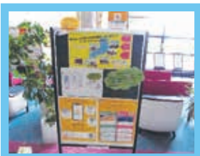
まちのコイン「ピワコ」