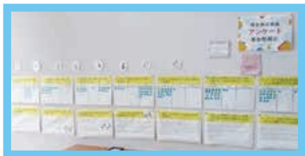
男女共同参画アンケートは、館内2か所で行いました