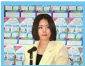
ジェンダー平等ミーティング (学生を中心とした若者が月に1回、テーマに沿って日頃考えていることなどを交流しています)