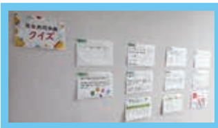
男女共同参画クイズの様子 (ジェンダーギャップ指数ってなあに? など、男女共同参画について知識を深めていただけるよう、参加型・クイズ形式で館内での啓発を行いました)