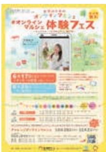
オンラインマルシェ体験フェスは、県内2会場(イオンモール草津・イオン長浜店)で実施しました