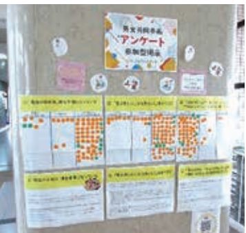
男女共同参画 アンケート 参加型掲示の様子