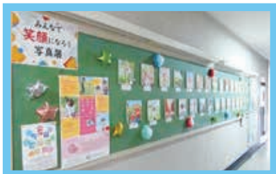
みんなで笑顔になろう 写真展 多くの方にご覧いただきました