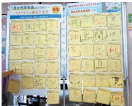
『「男女共同参画」をイメージする漢字一文字』募集