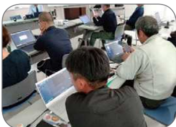
情報発信スキルアップ研修

「魚のゆりかご水田米」のブランド力向上を目的に、生産者自らが、YouTubeなどで情報発信できるよう研修を実施しています。また統一パッケージデザインの利用促進、百貨店等でのPR活動等を実施しています。