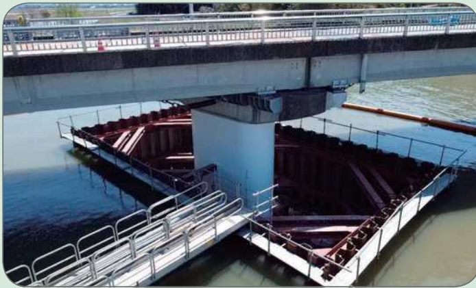
耐震化整備 施工状況