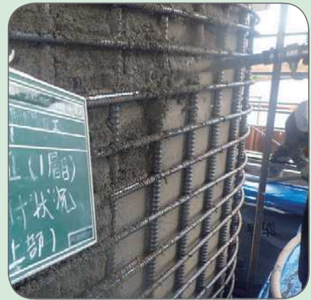
特殊ポリマーセメントモルタル 吹付

湖東地区広域営農団地農道は、近年、湖岸道路や国道8号、国道306号との連絡道路として、農業用施設をはじめ、住宅団地、公共施設等が多数立地しており、地域住民の生活道路としてだけでなく、広く利用されています。