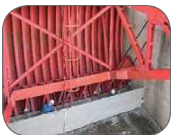
ダムゲートの点検