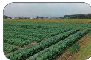
キャベツ（高収益作物）の収穫（東近江市）