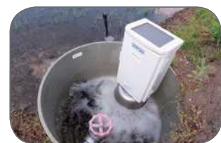
自動給水栓の導入