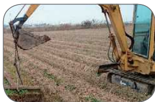
畦畔除去による区画拡大

基盤整備を機動的に進めるとともに、輪作体系の検討や導入1年目の種子・肥料への支援など、高収益作物への転換に向けた計画策定から営農定着に必要な取組をハードとソフトを組み合わせ支援します。