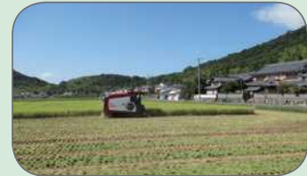
整備後の営農状況