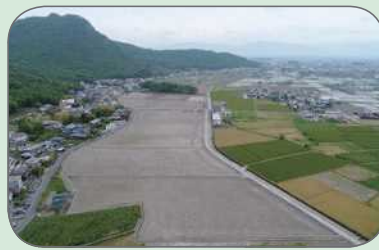
大区画に整備された農地