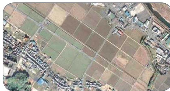
事業実施後（湖南省）