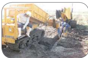
暗渠排水による汎用化