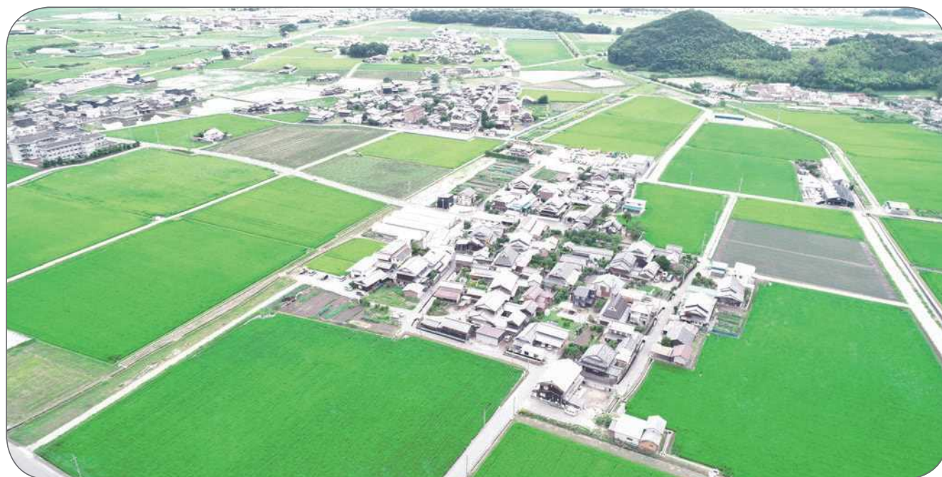
区画整理（東近江市）

農地の大区画化や汎用化（水田の畑地利用）、末端水路等の更新整備を行うことで、高い生産効率、高収益作物の導入・生産拡大等を可能とする農業基盤を整えます。さらに、農地中間管理機構と連携を図りながら、将来の農業生産を担う経営体（担い手）への農地の利用集積・集約化を推進し、大規模で安定した農業経営の実現を図ります。