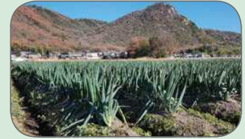
収穫前の太郎坊天狗ねぎ