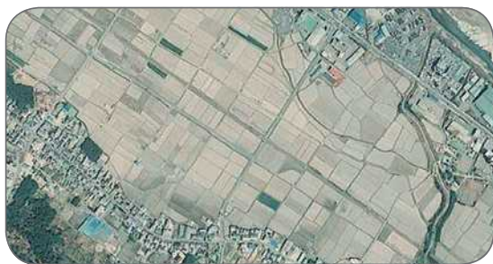
事業実施前（湖南省）