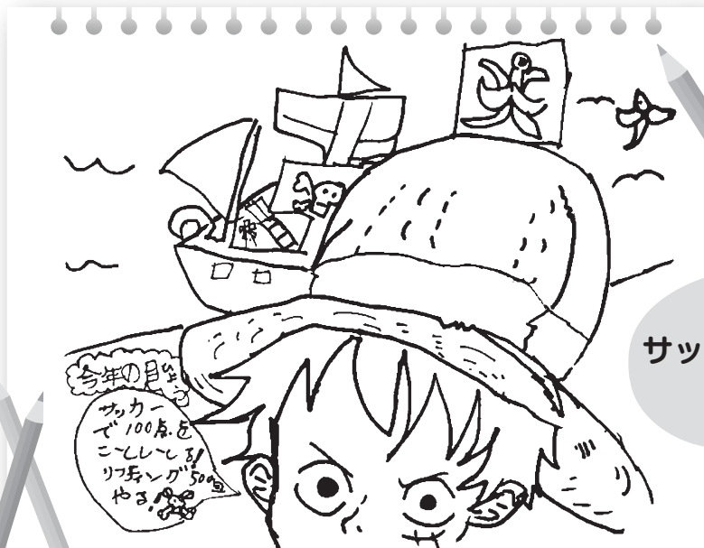
サッカーリンさんの作品