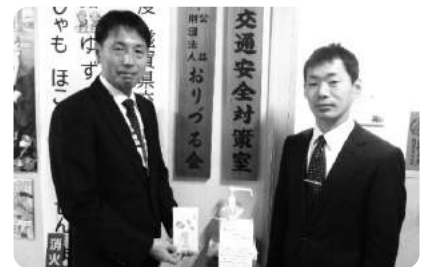
滋賀県神道青年会 様