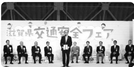
一般社団法人 滋賀県トラック協会 様 第8回滋賀県交通安全フェアにて

東近江市 (株)八日市自動車教習所 様 東近江警察署 様 東近江市役所 様 米原市 米原市役所 様 高島市 高島市役所 様 高島土木事務所 様 愛荘町 愛荘町役場 様 日野町 日野町役場 様 甲良町 甲良町役場 様 第8回滋賀県交通安全フェア設置 おりづる会事務局設置