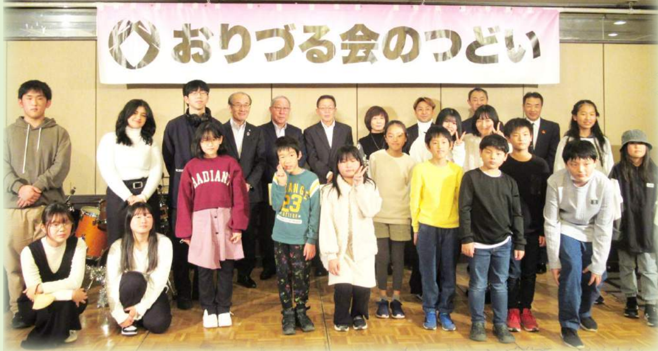
寄附者様への感謝状の贈呈