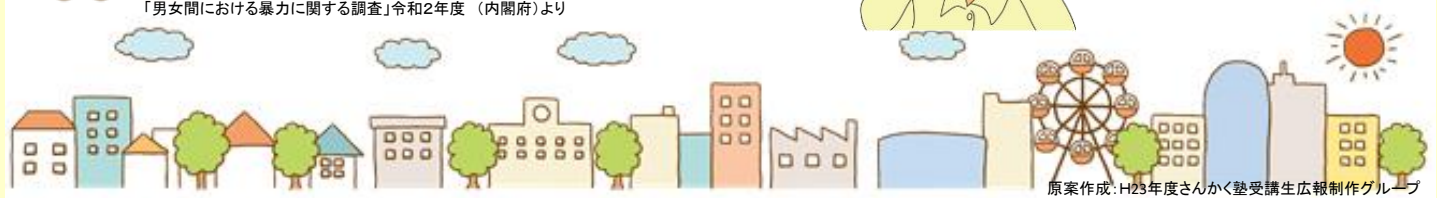
「男女間における暴力に関する調査」令和2年度（内閣府）より

男性も女性もDVの被害を受ける可能性があります。男女間の暴力、それは人権侵害です。人はだれもが大事にされるべき尊厳存在であり、身体的暴力はもちろんのこと、精神的なものなどを含め一切の暴力を受けてよい人など一人もいません。 自分のことを大切にするとともに相手のことを大切に、お互いが尊重し合える対等な関係を築いていきましょう。