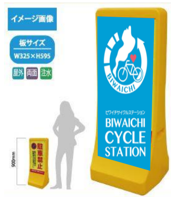
9 注水式スタンド看板(小)