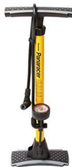
11 空気圧計付き三方式対応空気ポンプ