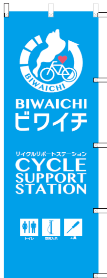
1 のぼり旗(サポステ)