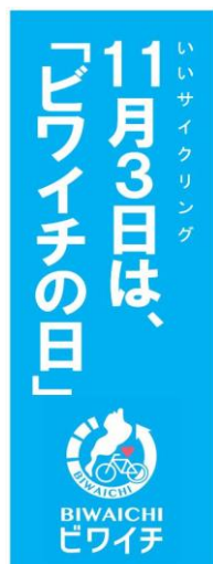
13 のぼり旗(ビワイチの日)