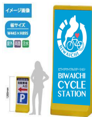
10 注水式スタンド看板(大)