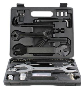
12 自転車用工具セット